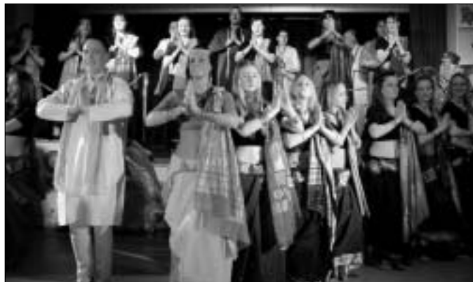
„Bollywood“ wird zum indischen Sommerfest am 2. Juni in Helberau getanzt.

Ob 22 kleine Hasen, 8 freche Hip- Hop Kids, ein steppendes Showtanzpaar oder amutige Stuhltanzgirls... für jeden ist was dabei. Sie sehen, unser Terminkalender ist zwar voll aber das ist ja der Sinn für eine tolle Tanzgruppe. Denn wir wollen alle unseren Eltern, Freunden und Weixdorfern zeigen, was wir in unserer Freizeit so anstellen und mit viel Spaß an einer Sache auch noch große Erfolge erzielen können.