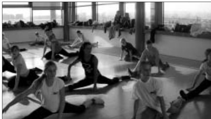
Sonntagstraining im BIG FUN

Ob 22 kleine Hasen, 8 freche Hip- Hop Kids, ein steppendes Showtanzpaar oder amutige Stuhltanzgirls... für jeden ist was dabei. Sie sehen, unser Terminkalender ist zwar voll aber das ist ja der Sinn für eine tolle Tanzgruppe. Denn wir wollen alle unseren Eltern, Freunden und Weixdorfern zeigen, was wir in unserer Freizeit so anstellen und mit viel Spaß an einer Sache auch noch große Erfolge erzielen können.