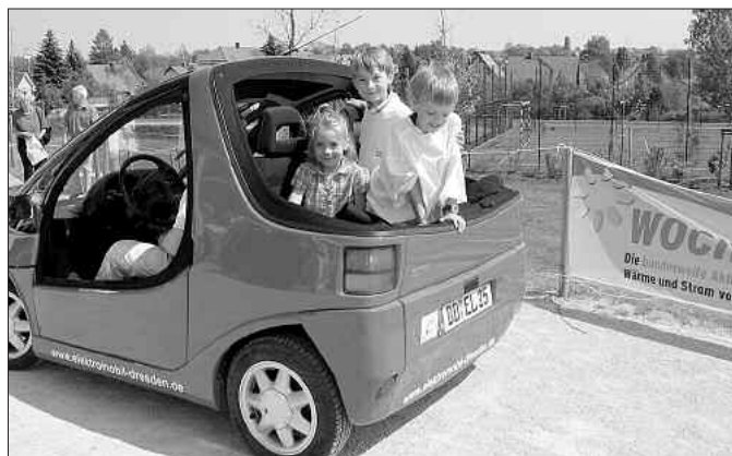
Der „Hotzenblitz“ startet zur Spazierfahrt