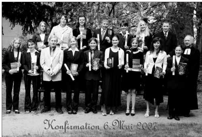
Konfirmation - 2007

Schließlich gilt unser Dank allen Verwandten, Nachbarn, Freunden und Bekannten, der Jungen Gemeinde und dem Kirchenvorstand für die vielen Glückwünsche und Geschenke sowie dem Fotografen Herrn Scholz für die gelungenen Bilder.