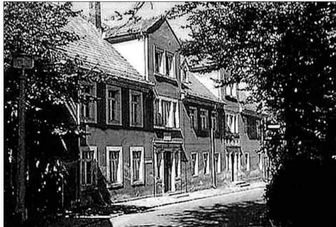
Das alte Schulgebäude in der Kirchgasse in Lausa