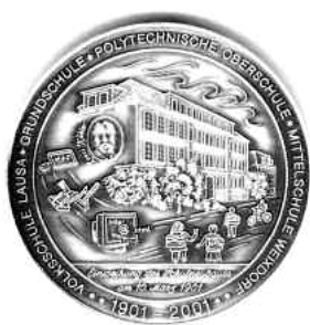
(Abb.) Vorderseite der Medaille