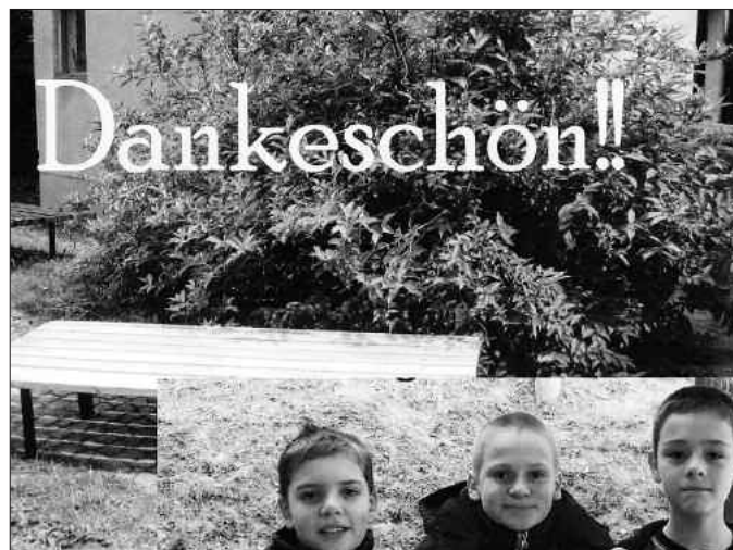
Handwerkerverein „Einigkeit“ Lausa 1888 e. V. - immer eine sichere Bank für Weixdorf