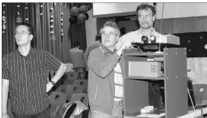
Foto: Tobias Ecke, Carsten Pauling, Ulf Seyfert (v. l.) Fotoclub Reflex

Zur diesjährigen Diashow luden wir unsere Gäste auf eine Reise durch Deutschland, Europa und Amerika ein. Als Reiseleiter fungierten - mit einer erfrischenden Einführung - der neue Clubchef Tobias Ecke sowie Ulf Seyfert, der souverän die Technik bediente.