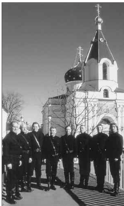
Die Maxim Kowalew Don Kosaken laden zu einem Konzert am Freitag, 30.01.2009, 19.30 Uhr in die Weixdorfer Kirche ein.