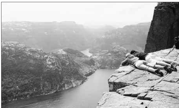
Norwegen, C. Pauling

Unter dem Motto „ Ortswechsel “ präsentieren wir Ihnen digitale Bildershows unter anderem zu folgenden Themen: Norwegen zwischen Bergen und Stavanger, Inseln mit Flair - Sardinien und Madeira, Schönes Havelland mit Schloss Rheinsberg, Aus Alt mach Neu - die baulichen Veränderungen in Dresdens Innenstadt. Weiterhin haben wir Eindrücke vom Ewald-Kluge-Gedenklauf zusammengestellt sowie Impressionen aus Weixdorf und Marsdorf.