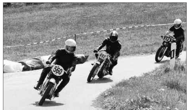
Ewald-Kluge-Gedenklauf, U. Klotzsche

Aufgrund der Umbauten in der Weixdorfer Mittelschule mussten wir den Diaabend sowohl räumlich als auch zeitlich verlegen. Sie sind herzlich eingeladen in den Dixiebahnhof Weixdorf, Beginn ist 20.00 Uhr , Einlass ab 19.00 Uhr, der Eintritt ist frei.