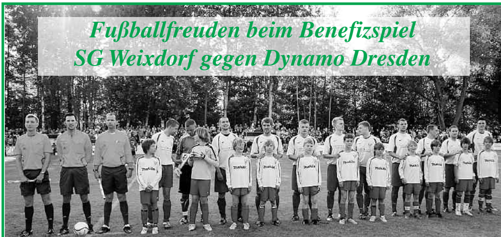
Die Weixdorfer Mannschaft vor dem Anpfiff