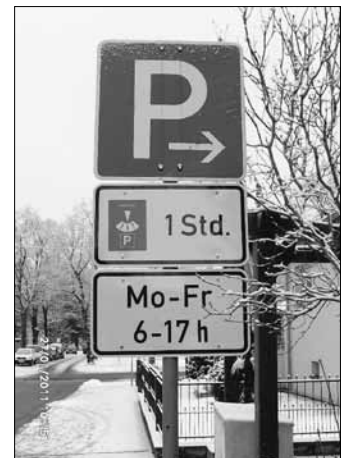
Parkplatz - Ende