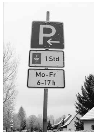
Parkplatz - Beginn

seit dem 26.01.2011 stehen auf der Straße „Zum Bahnhof“ gegenüber der Kindertagesstätte „Heideland“, in der Ortschaft Weixdorf neue Verkehrszeichen.