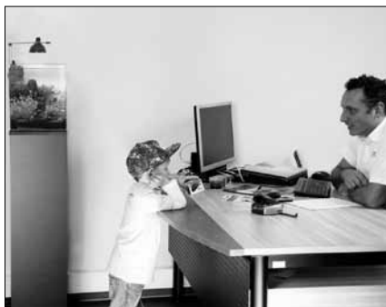
Mit einem Aquarium für Unterwasserpflanzen holt man sich ein Stück Natur ins Haus.

Die aqua style-Becken sind zwar nicht für Fische geeignet, doch Garnelen und Zierschnecken lassen sich auch in diesen Aquarien halten. Die Becken sind in drei Größen zu haben. Die kleinste Variante hat eine Grundfläche von 24 mal 24 Zentimetern, bei dem größten Modell sind es 31 Zentimeter im Quadrat. Damit das Wasser schön klar bleibt, setzt man einen praktischen Eckfilter ein. Der bildet mit der Lampe eine Einheit und wird auch gleich komplett mit Filtermaterialien geliefert. Mehr Infos und den „Ratgeber Aquarium“ gibt es auf www.eheim.de .