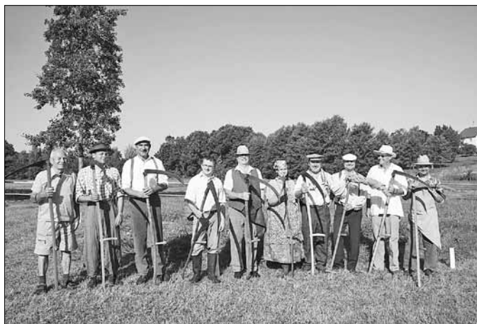
Die Schnitter von 2010

Mitstreiter für das Wettsensen möchten sich bitte anmelden, es stehen nur begrenzte Flächen zur Verfügung. Damit ist auch die Anzahl der Schnitter begrenzt.