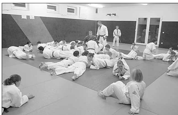
Aufwärmspiel „drunter und drüber“