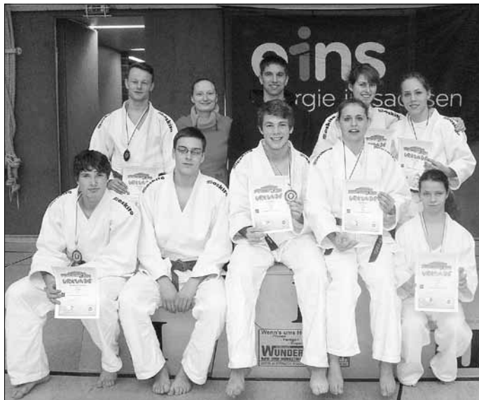
Die Teilnehmer der Landeseinzelmeisterschaften U21 am 03.02.2013 in Rodewisch